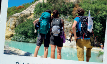
Patrimonio termal y otros en los caminos a Roma

1 ▶ Mítica ruta de peregrinación que atraviesa Europa hacia la tumba del apóstol Santiago el Mayor en Santiago de Compostela . El piloto se centrará en distintos tramos de la comunidad autónoma de Galicia y el norte de Portugal : el Camino Francés , el Camino de Invierno y el Camino Portugués por la Costa .