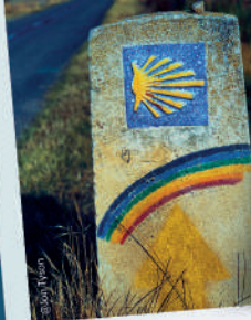
Patrimonio literario en los caminos de Santiago de Compostela